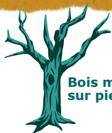
Bois mort sur pied

Le bois mort est évalué en mètre cube par hectare. Beaucoup d'espèces utiles à la forêt dépendent de sa présence. Le WWF recommande un minimum de 40 m 3 de bois mort par hectare dans les forêts gérées. On trouve en moyenne 130 m 3 de bois mort par hectare dans les forêts européennes tempérées naturelles (non exploitées).